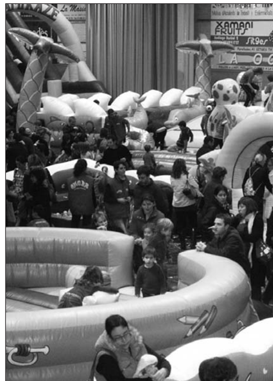
Parc de Nadal. Arxiu 2008

Coincidint amb les vacances escolars, els més menuts i els joves també podran gaudir de diferents propostes lúdiques al Parc de Nadal, situat al pavelló II de Pins Vens. Del 27 de desembre al 4 de gener el recinte estarà obert per disposar de 8 inflables adequats a les diferents edats, participar en el taller amb el ninot trainer de la colla Jove de Castellers de Sitges, explorar la moto i el cotxe oficial dels mossos d'esquadra, pujar a una ambulància i un vehicle adaptat per a persones amb discapacitat de la Creu Roja o passejar dalt d'un poni o cavall.