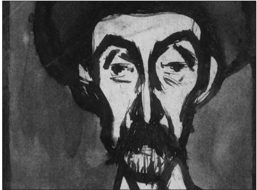
Detall de Retrat d'Utrillo de Pablo Picasso