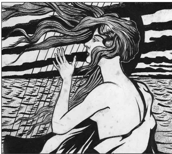
Detall d' Al vent , de Miquel Utrillo

Coincidint amb el dia de l'artista, s'ha inaugurat Miquel Utrillo i les arts, la segona de les exposicions de la "Commemoració Miquel Utrillo 1862-1934" que celebra Sitges des de principis d'any. La mostra, concebuda com l'acte central d'aquest esdeveniment, focalitza l'evolució del personatge en relació amb la seva vocació, dedicació i entorn artístic a través d'àlbums d'adolescència, dibuixos, olis, il·lustracions i cartells que conformen l'obra plàstica d'Utrillo. Hi figuren també obres d'artistes relacionats amb Utrillo i d'ell mateix com a crític d'art (Manolo, Picasso o Sunyer), així com la seva iconografia, amb obres de Rusiñol, Casas, Picasso, Bagaria, Ismael Smith o Rafael Padilla, entre d'altres.