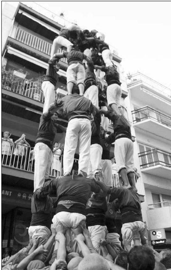
5 de 7 de la Jove de Sitges dissabte passat

5de7, 4de7 amb l'agulla i 4de7 en una Santa Tecla amb accent italià